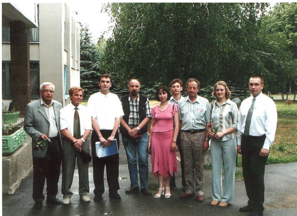
Фото на память с выпускниками.