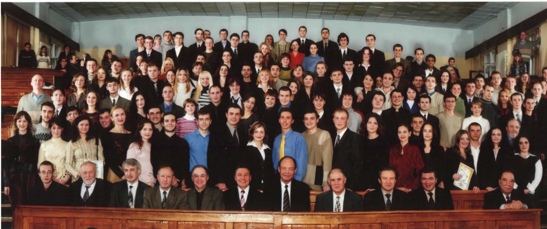
Вручение «красных» дипломов. 2006 г.