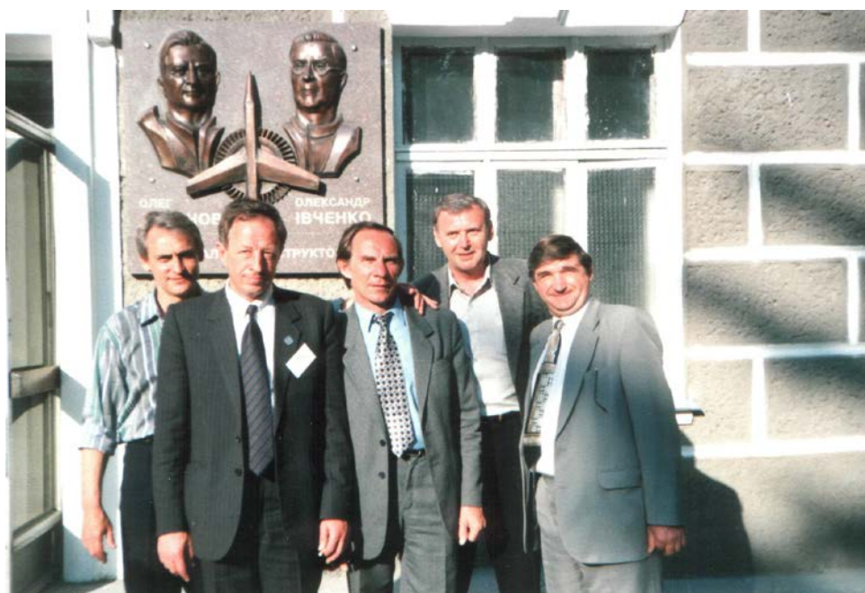
Встреча с однокурсниками 2001 г.