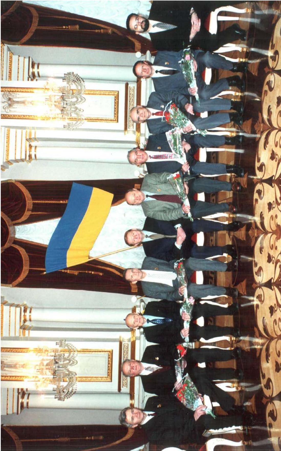
Вручение Государственной Премии Украины в области науки и техники 1995 г.