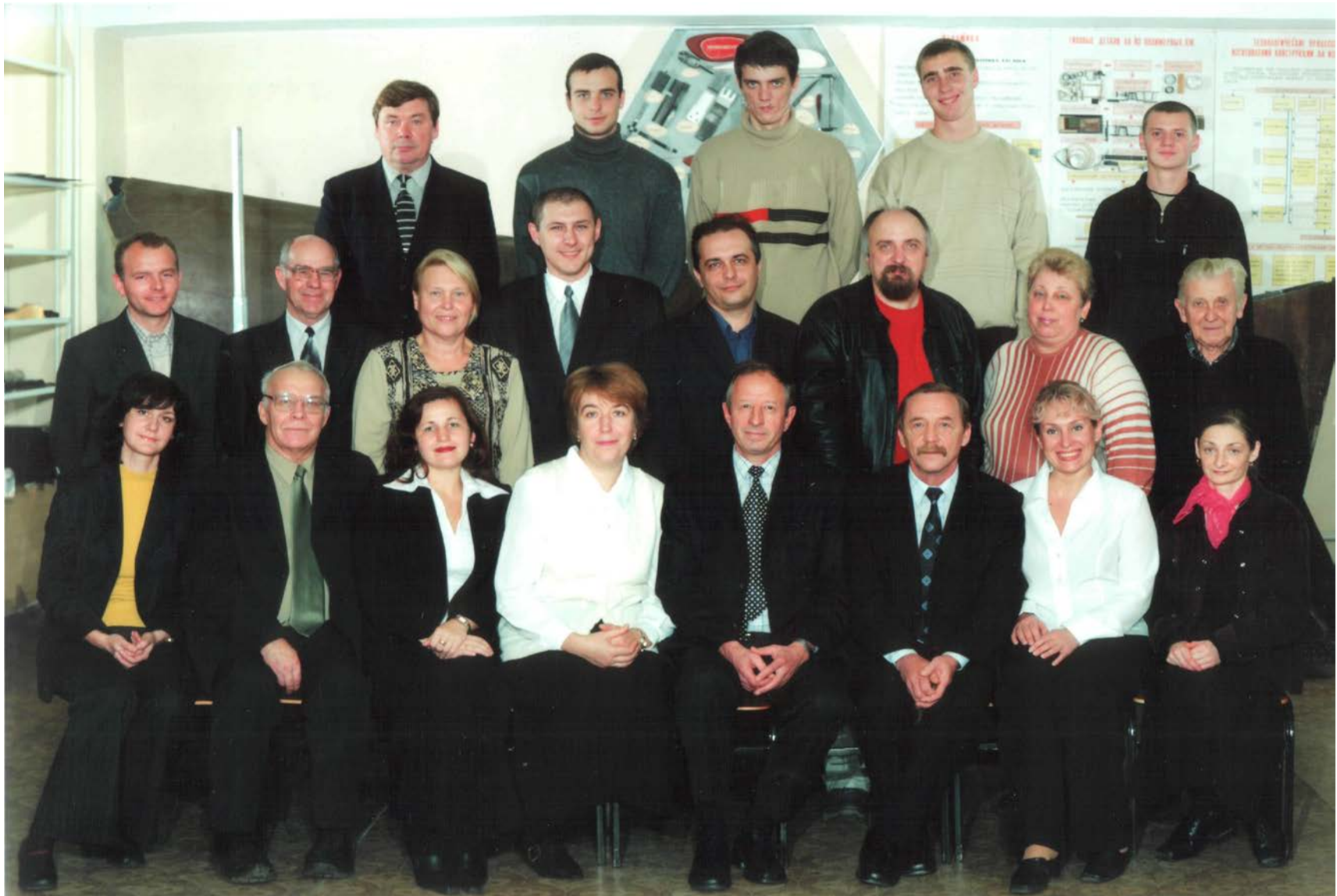
Кафедра авиационного материаловедения. 2003 г