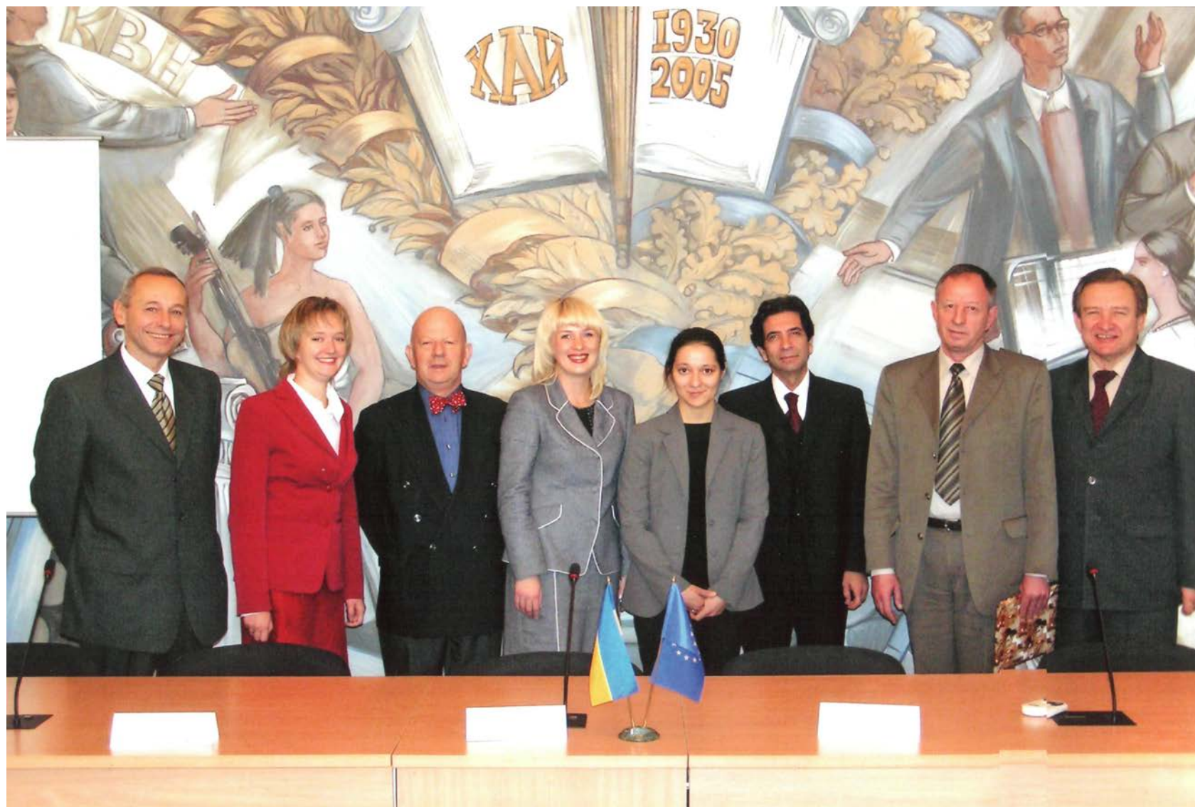
Встреча с французской делегацией.