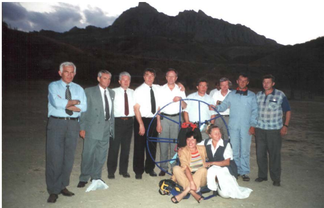
На юбилее НИИ АУС. Коктебель, 2004 г.