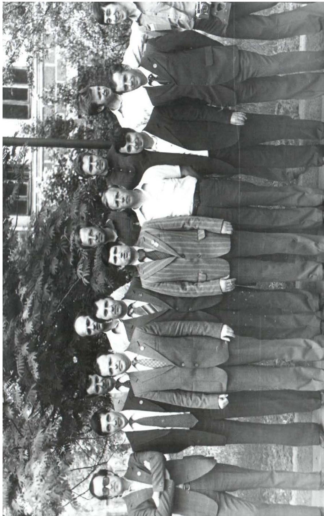
Последний звонок. Группа 167. 1970 г.