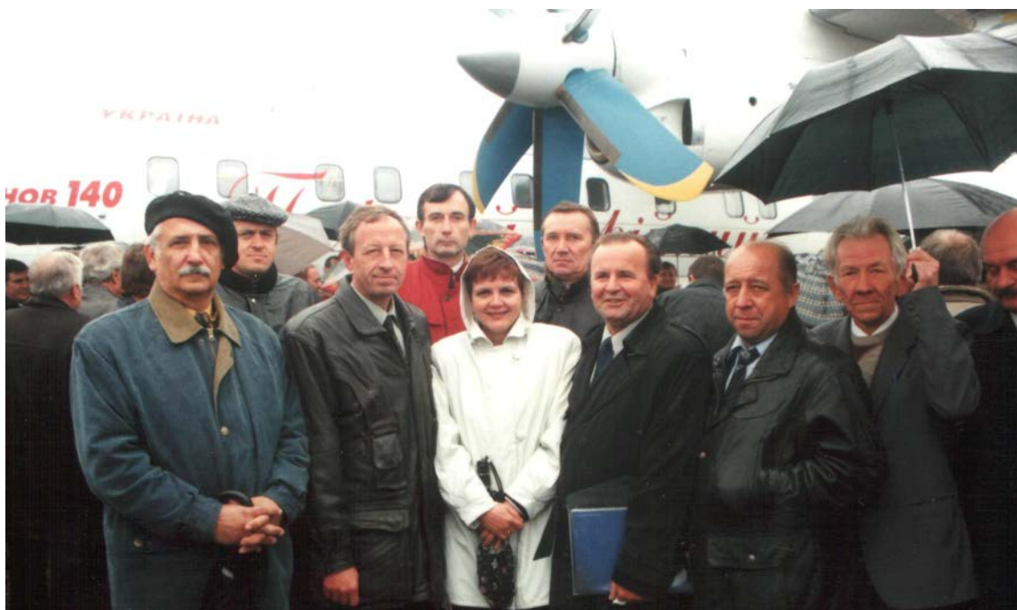
В составе делегации ХАИ на ХГАПШ.