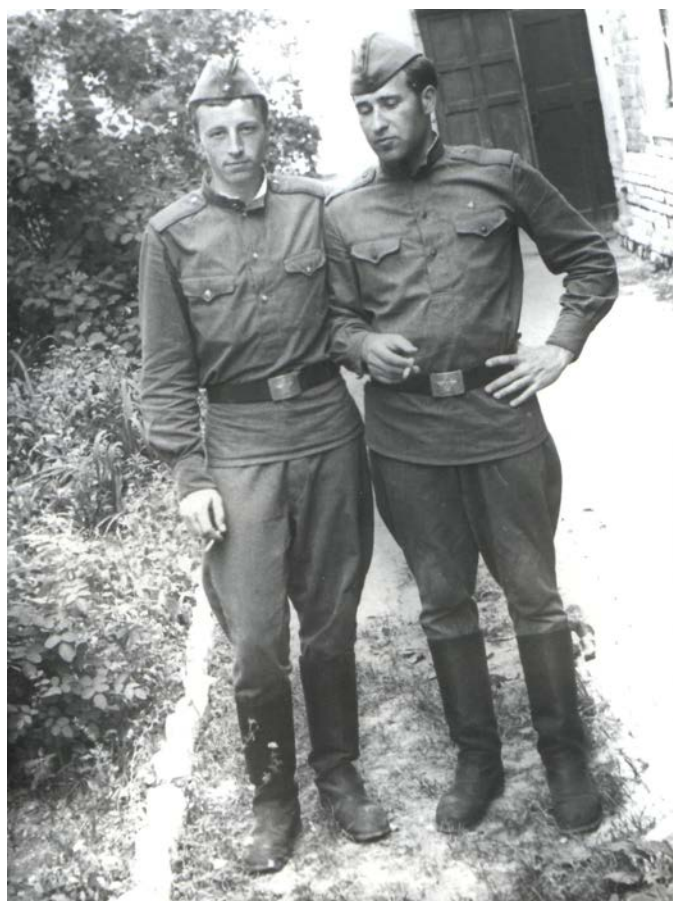
Будущий лейтенант-инженер. 1970 г.