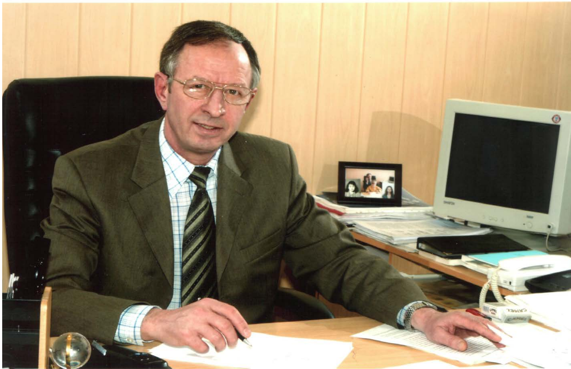
На рабочем месте. 2003 г.